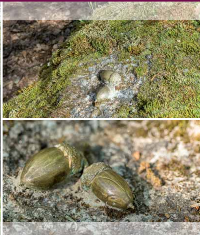
Félix Curto | Piezas doradas

Sonidos dorados. Dorados frutos. Suenan el viento en los robles. Las notas se enredan en las ramas..