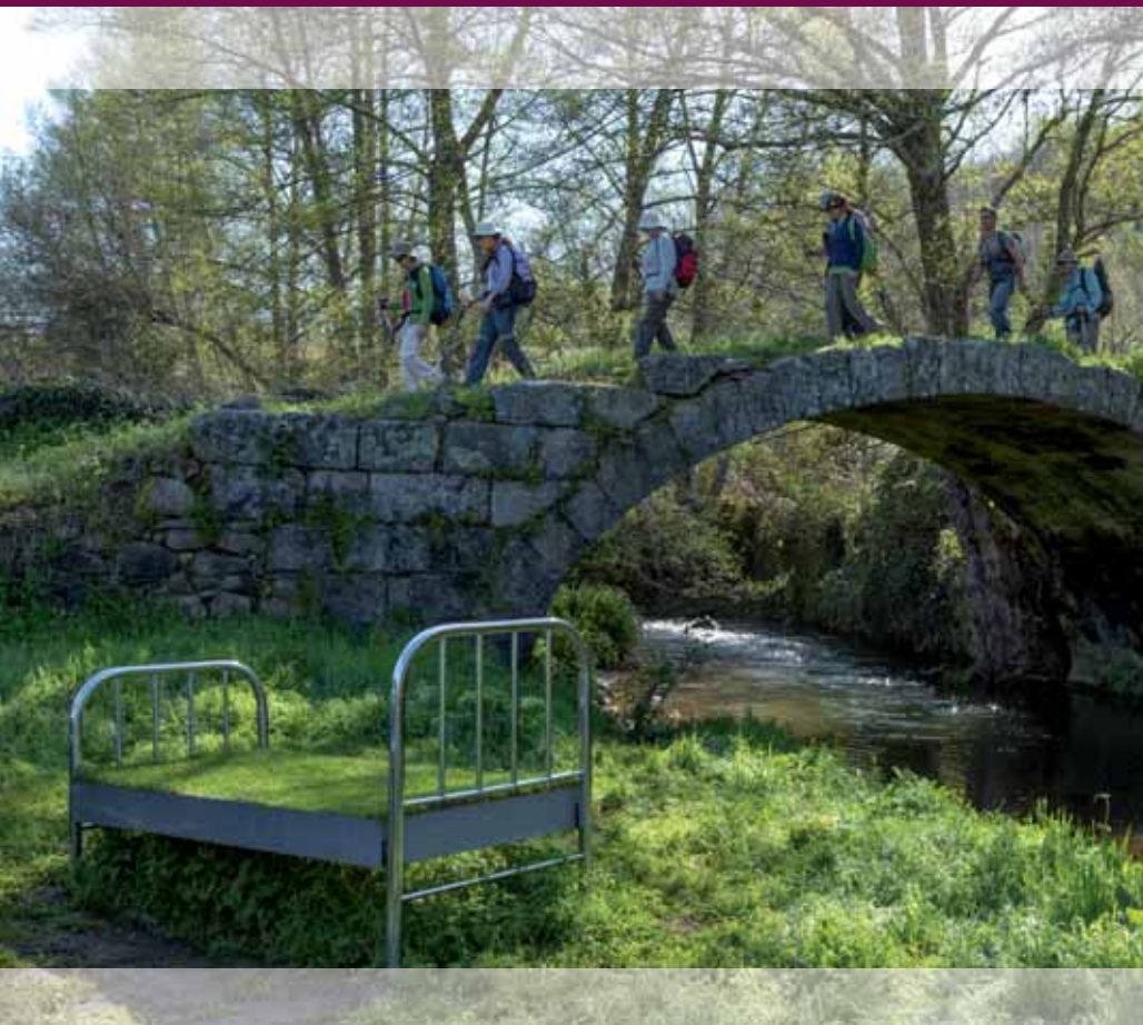
Alfredo Omaña | Instalación cama

La cama también es un puente. ¿A dónde te lleva esta? ¿Y los sonidos que escuchas?