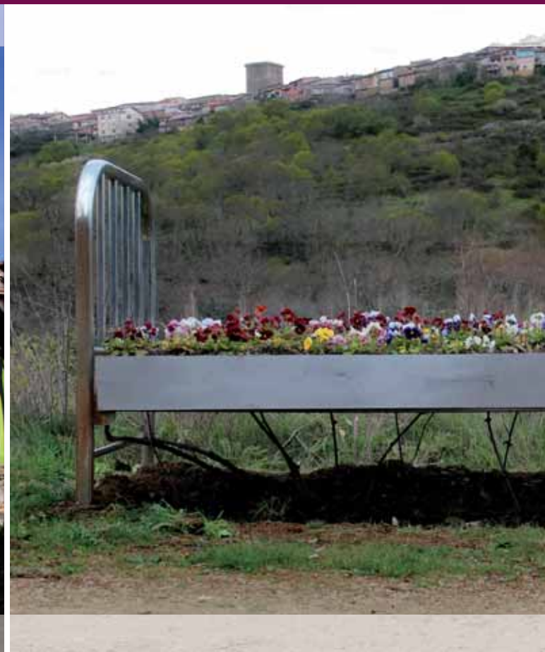
Alfredo Omaña | Instalación cama

Crece mientras miras. Palpita la savia. Palpita la gente tras los muros. La vida se esconde.