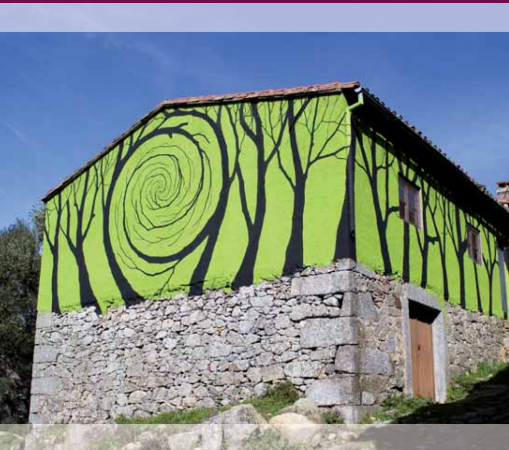
Pablo S. Herrero | Pintura sobre muro

Los árboles no dejan ver el bosque. Verde vida. Vórtice. Prodigiosas transformaciones. ¿Quién habita en los espacios vacíos?