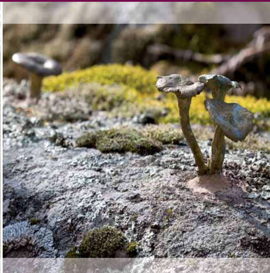
Félix Curto | Piezas doradas

En las piedras, mantos verdes. El dorado asoma. El prodigio te rodea ¿lo puedes tocar?