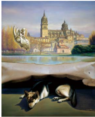
A la sombra del Tormes 100 x 81 cm