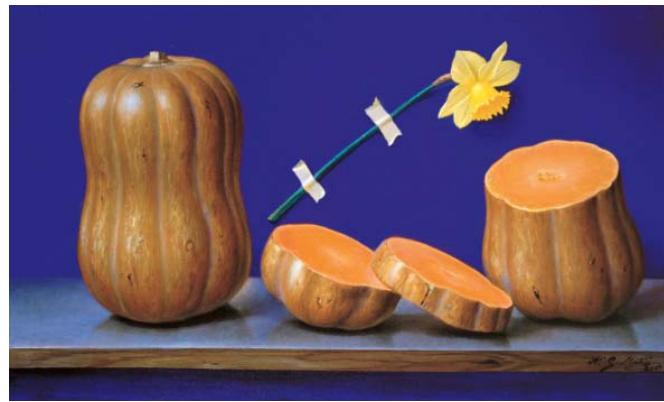
Calabazas con flor 55 x 33 cm