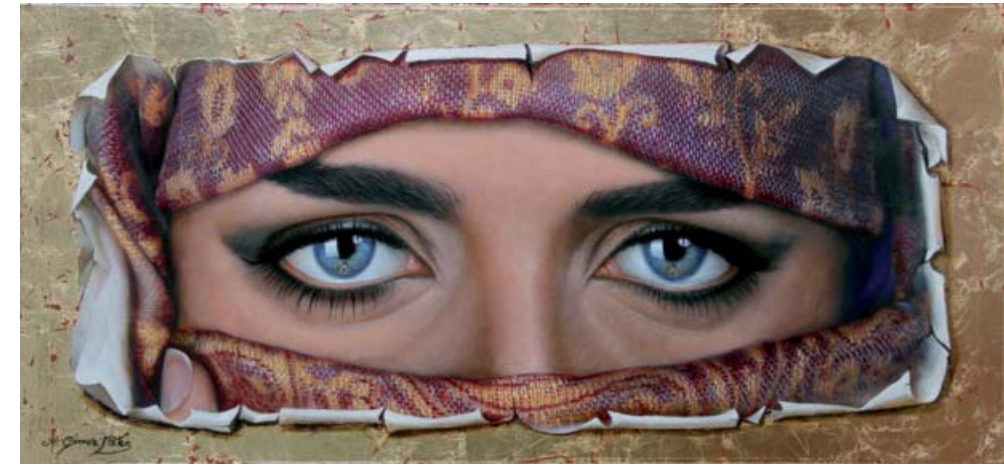
Mirando al pintor. 103 x 46 cm

Mi identidad como pintor podría encuadrarme en el «nuevo realismo», rayando siempre en el «simbolismo» con un poco de «surrealismo». Mi meta, llegar a la sensibilidad de todo tipo de público, independientemente de su formación pictórica: este es el gran lenguaje de la pintura.