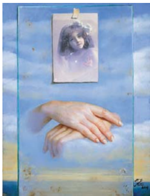
Evocacion 35 x 27cm