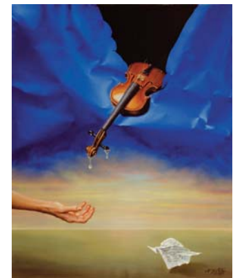
Musica rota II 81 x 65 cm