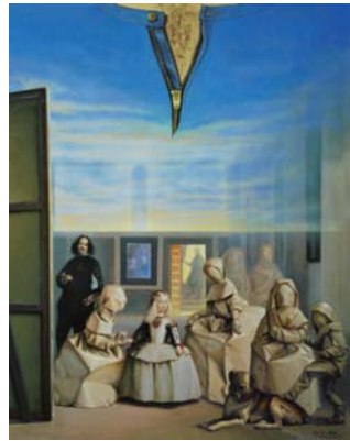
Abriendo las Meninas 92 x 73 cm