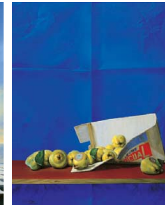
Membrillos 92 x 73 cm