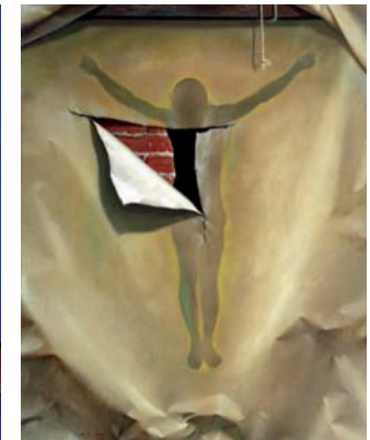
Tras el muro I 116 x 89 cm