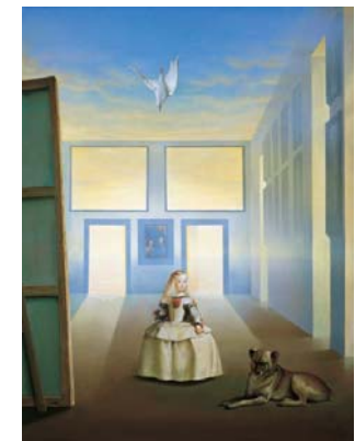
Libertad vigilada 116 x 89 cm