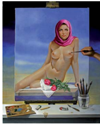
Creando el cuadro, 2013 100 X 81 cm