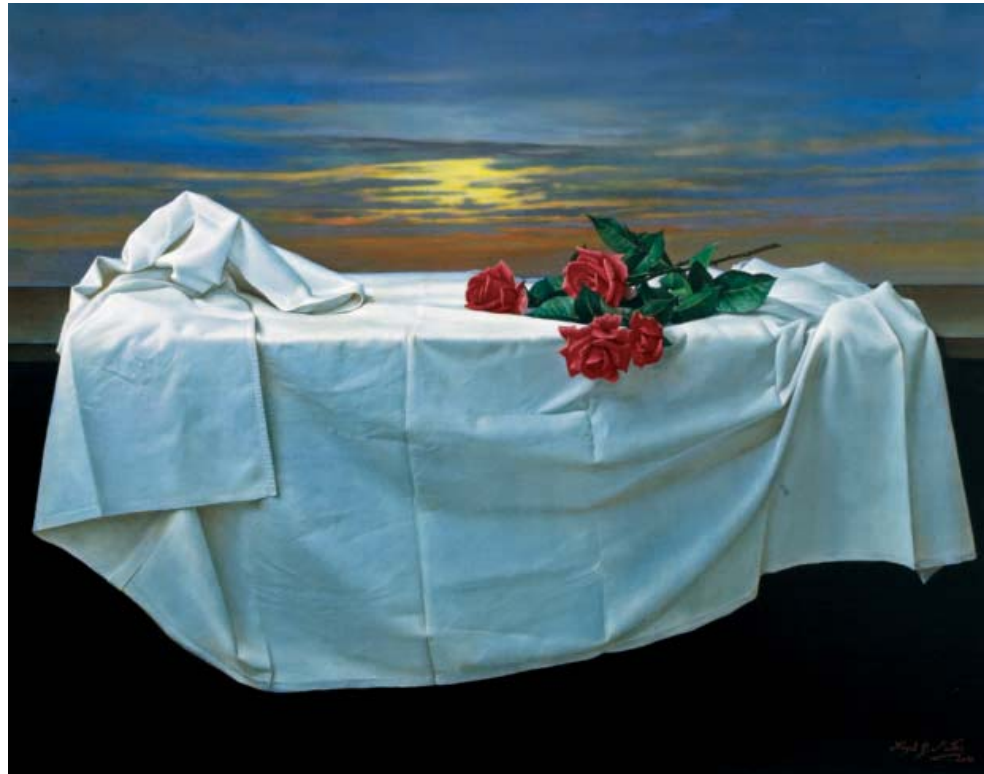
Mantel con rosas al amanecer 81 x 100 cm