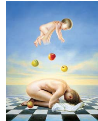
Maternidad frustrada 100 x 81 cm