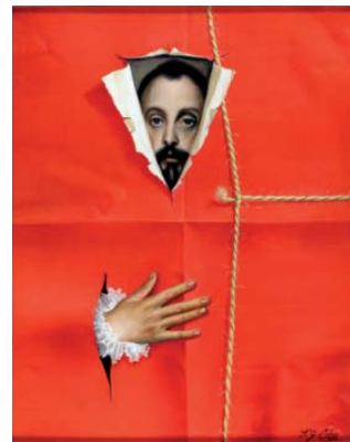
Greco. Embalaje 81 x 65 cm