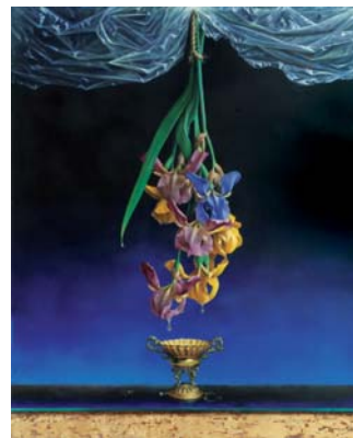
La esencia de la flor 100 x 81 cm

San Esteban y Santibáñez Del 31 de julio al 6 de agosto Salas de exposiciones municipales