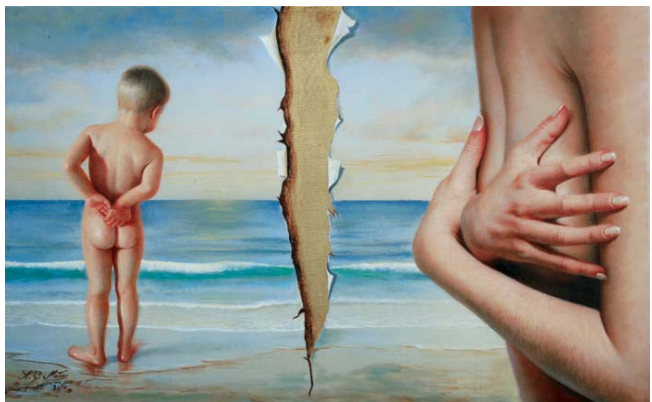
Deseo II 38 x 61 cm