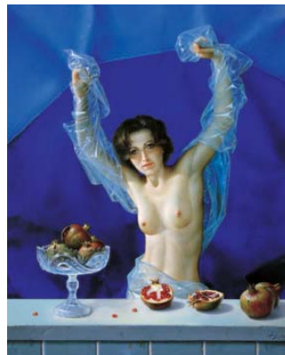
Granadas 81 x 65 cm