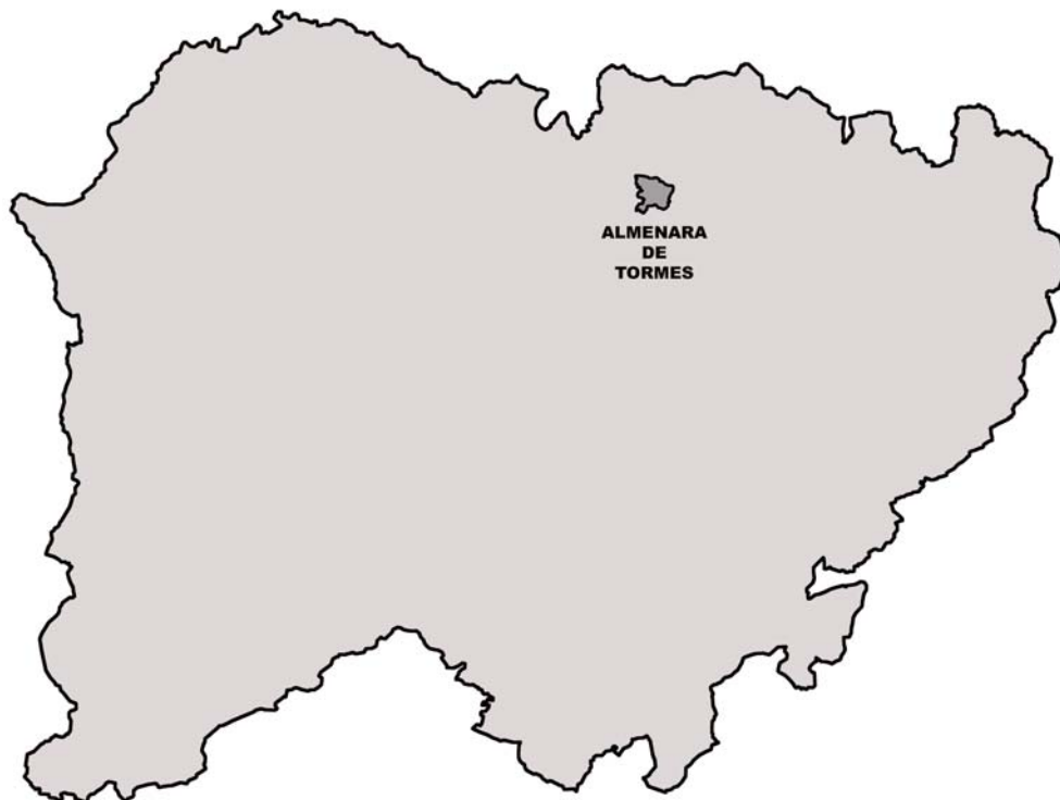
Fig. 1.- Plano de la provincia de Salamanca con el término de Almenara de Tormes

El término municipal de Almenara de Tormes se localiza al Nordeste de la provincia de Salamanca, a unos 18 km al Noroeste de la capital salmantina por la carretera provincial SA-300, formando parte de la comarca de “Tierra de Ledesma”. Este término, cuya superficie es de 19,29 km 2 y su altitud media es de 782 m sobre el nivel del mar, delimita al Norte con los T.M. de San Pelayo de Guareña, El Arco, Aldearrodrigo y Torresmenudas; al Este con Valverdón; al Sur con El Pino de Tormes y Zarapicos; y al Oeste con San Pedro del Valle y Juzbado.