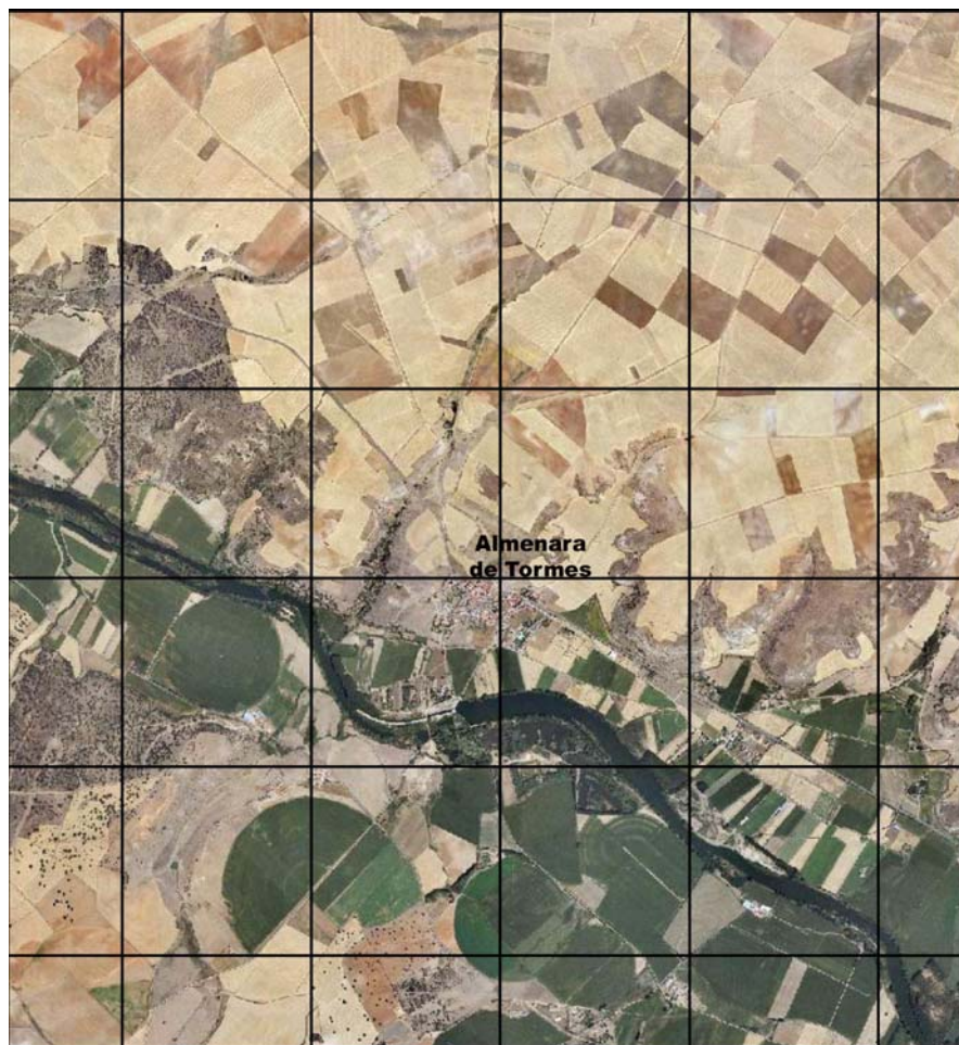
Fig. 2.- Vista aérea del término municipal de Almenara de Tormes

El término municipal de Almenara, en su zona más meridional, es cruzado en sentido Sureste-Noroeste por el río Tormes, situándose el casco urbano en la margen derecha del mismo, sobre la terraza marcada entre las curvas de nivel de 770 m y 790 m. El poblamiento describe un perímetro más o menos circular, viéndose atravesado de Este a Oeste por la carretera de Salamanca a Ledesma (SA-300). Las condiciones topográficas y edáficas del terreno donde se enclava Almenara de Tormes, en la llanura sedimentaria del Nordeste provincial, favorecen una ocupación agrícola, entremezclándose en el mismo término municipal las tierras cultivadas de secano, localizadas al Norte del municipio y las tierras de regadío articuladas entorno a la vega del río Tormes.